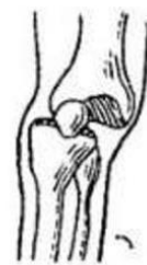
вывих сустава внутрь