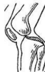
вывих сустава вперед