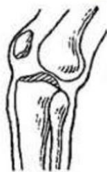
вывих сустава вперед