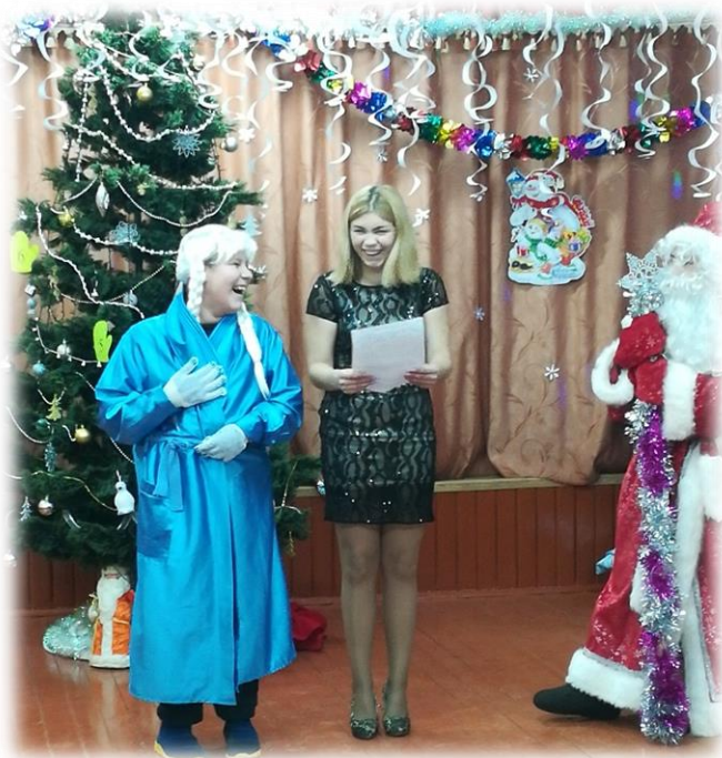
Сценка «Переодетая Снегурочка»