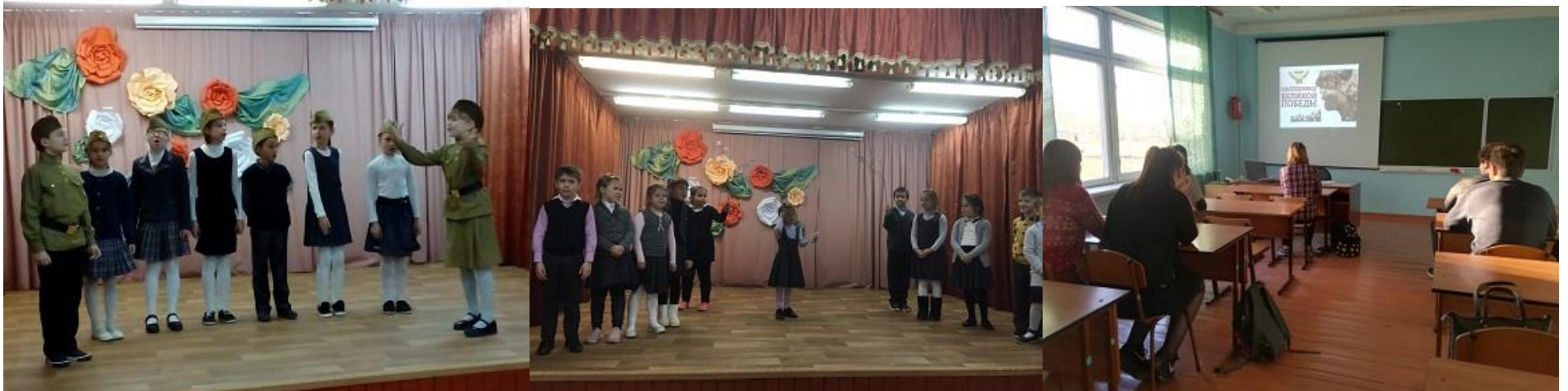
Учащиеся начальной школы исполняют песни военных лет

19 ноября 2019 года в МБОУ «Самотовинская СОШ» состоялось открытие Рождественских чтений. В начальной школе был песенный марафон «Песни с которыми мы победили». В исполнении учащихся 1-4 классов услышали такие песни, как «Катюша», «Три танкиста», «Смуглянка», «День Победы», «Солнечный круг». В 5-9 классах состоялись памятные классные часы «Наследники Великой Победы»