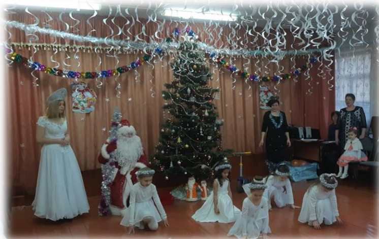
«Танец снежинок» (ученицы 1,3 классов)

Праздник удался на славу, прошел весело и задорно!