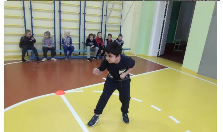
Учащиеся школы сдают нормы ГТО