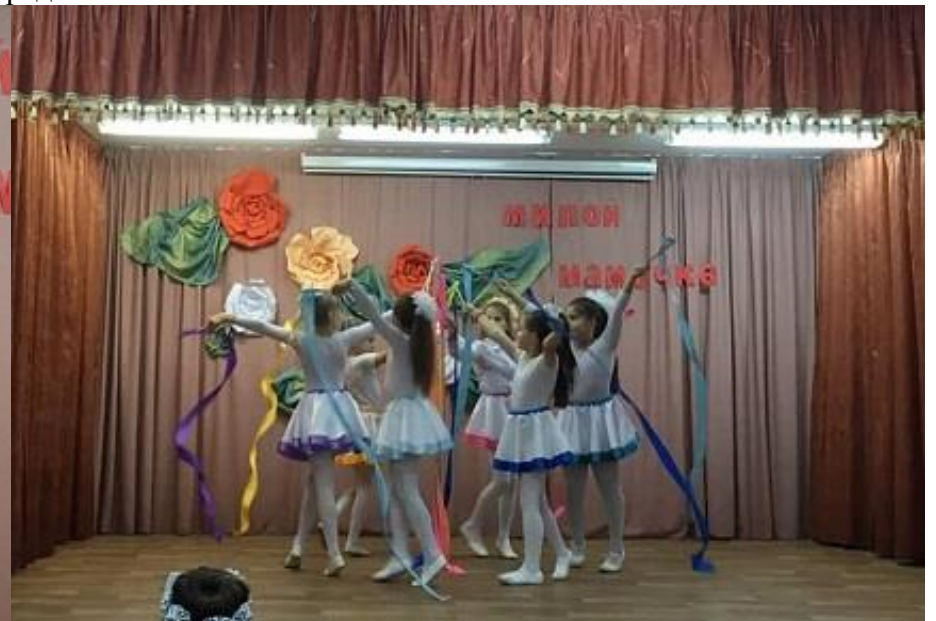
Учащиеся начальной школы поздравляют своих мам