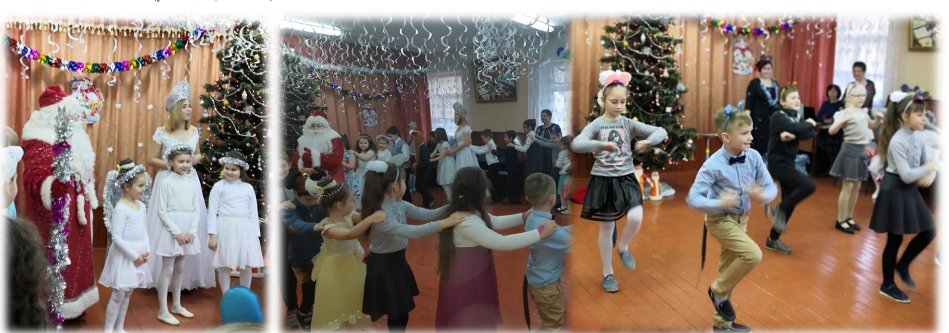
«Новогодний хоровод» учащиеся 1-4 классов