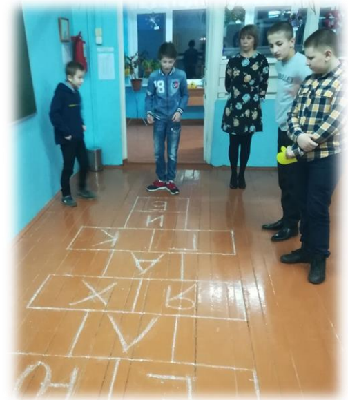
Учащиеся 6 кл. на этапе «Буквенные классики»