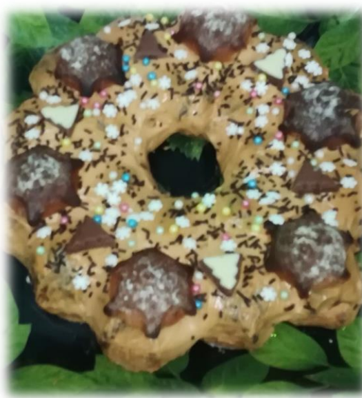
Новогодние пироги, которые учащиеся 5-9 класса сделали своими руками