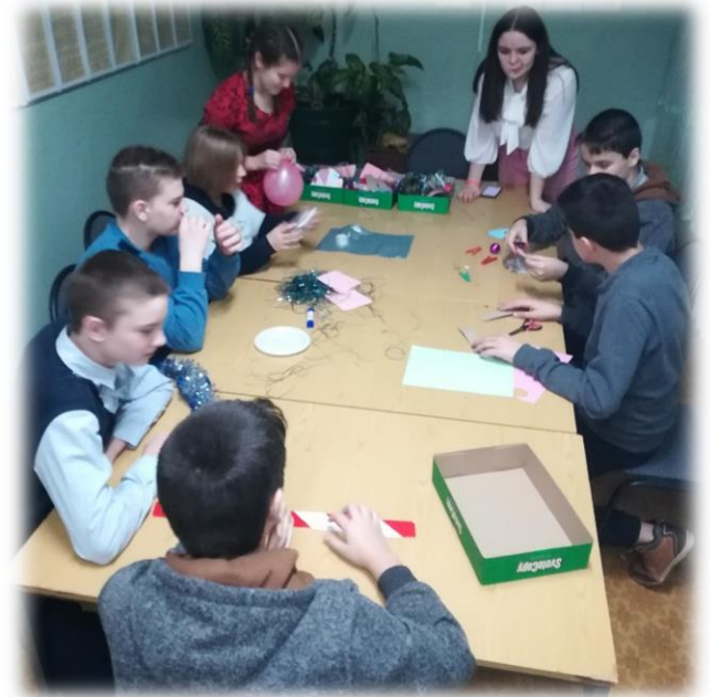
Учащиеся 7 кл. на этапе «Создание новогодней игрушки»

27 декабря 2019 года в нашей школе прошел Новогодний квест, в котором принимали участие ученики 5-9 классов. Квест - это увлекательное командное приключение с поиском спрятанного сюрприза: ребята на каждом этапе выполняли интересные и разнообразные задания, разгадывали головоломки, за которые получали подсказки, где найти спрятанный подарок - сюрприз. Все ученики легко справились с поставленными задачами, проявив смекалку и сообразительность. А также для учащихся был объявлен конкурс «Новогодний Рождественский пирог». После прохождения квеста состоялась дегустация пирогов и награждение участников в различных номинациях. Праздник завершился новогодней дискотекой.